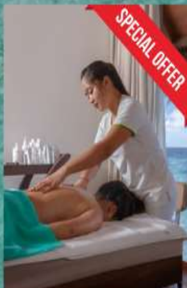
SPA 30 mins