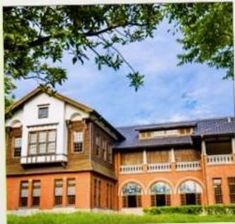
พิพิธภัณฑน์น้ำพุร้อนเป่ย์โถว