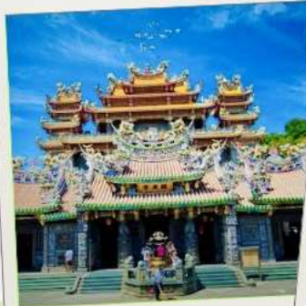
วัดกวนตู่