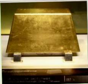
พิพิธภัณฑ์ทองคำ