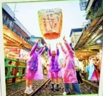
ปล่อยโคมลอย