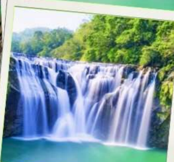
น้ำตกซือเฟิ่น