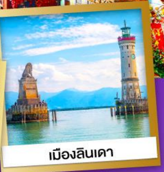
เมืองลินเดา