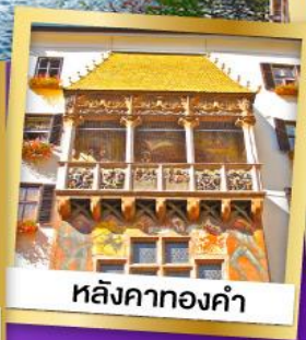
หลังคาทองคำ