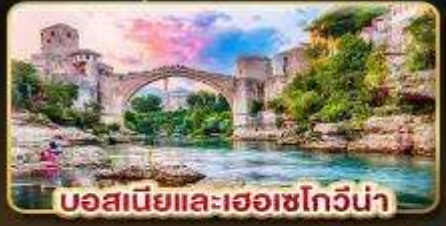
บอสเนียและเฮอซโกวีนา