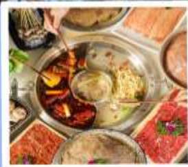
หม้อไฟหมาล่า