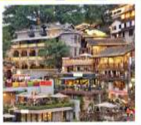
ตรอกโบราณเซี่ยฮ่าวหลี่