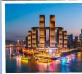
ตึกราวฟีฟ่า