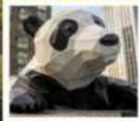
ห้าง IFS แพนด้าปิ่นตึก