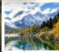
ปี้เพิงโกว