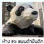
ห้าง IFS แพนด้าปิ่นตึก