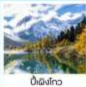
ปี้ผิงโกว