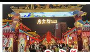
ถนนคนเดินต้าถิง