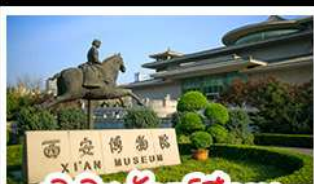
พิพิธภัณฑ์ซีอาน