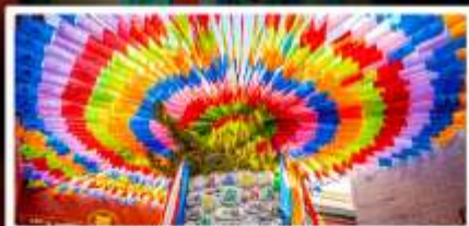
วัดลามะกว้างเหิน