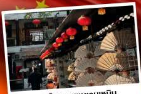
ถนนโบราณซูหยวนเหมิน