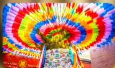
วัดลามะกว้างเหริน