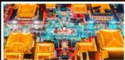
ถนนวัฒนธรรมต้าถิง