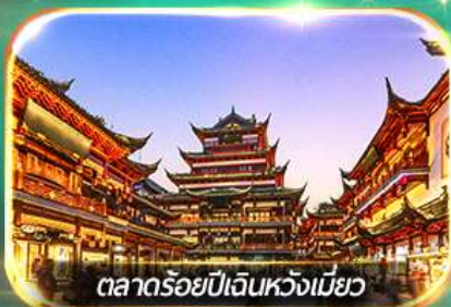
ตลาดร้อยปีเงินหวังเหมียว