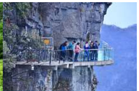
หน้าผาลอยฟ้ากามเดินกระจก

หลังอาหาร ไกด์นำเสนอโปรแกรมทัวร์เสริมหรือ OPTIONAL TOUR แพคเกจท่องเที่ยวภูเขาเทียนเหมินซานหรือภูเขาถ้ำประตูลูกเต๋อ อัตราค่าบริการท่านละ 600 หยวนหรือ 3,000 บาท อัตรานี้รวมค่าบริการเข้าอุทยานฯ รถรับส่ง กระเช้าขึ้น ลงเขาเทียนเหมินซาน ระเบียบกระจกเลียบน้ำผา บันไดเลื่อนทะเลภูเขา ค่าประกันอุบัติเหตุ และค่าบริการของไกด์ท้องถิ่น ระยะเวลาสำหรับแพคเกจประมาณ 3-4 ชั่วโมง (ขึ้นอยู่กับจำนวนนักท่องเที่ยวในแต่ละวัน)