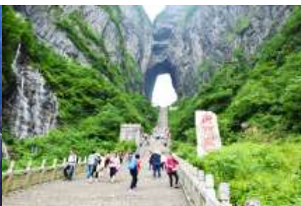
ประตูลูกเต๋อ