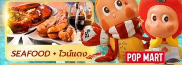
SEAFOOD + ไวน์แดง