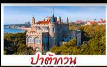
ป่าตึกวน

พระราชวังฤดูร้อน - วิวเมืองซิงเต่า รถไฟความเร็วสูง - ภูเขาเหลาซาน กำแพงเมืองจีนด่านจวิรงกวน - ป่าตึกวน พักโรงแรมระดับ 4 ดาว - ไม่หลงร้านช้อปปิ้ง มือพิเศษ เปิดปักกิ่ง , หม้อไฟซีฟู้ด