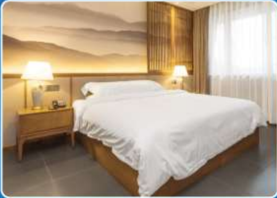
👤 SINGLE (SGL)