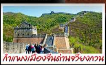
กำแพงเมืองจีนด่านจวิรงกวน