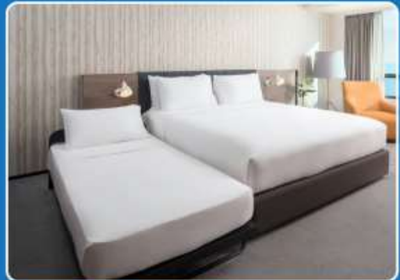
👤👤+👤 TRIPLE (TRP)

**รูปภาพห้องพักเป็นเพียงภาพสื่อถึงประเภทของเตียงเท่านั้น ไม่ใช่ภาพห้องพักจริงสำหรับการเข้าพัก**