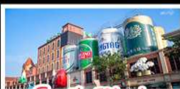
โรงเบียร์ซิงเต่า