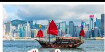
เมืองอ่องกง

เมืองเก่าซิงเต่า - วิวเมืองอ่องกง โรงเบียร์ซิงเต่า - ท่าเรือชาวประมงเยียนโต