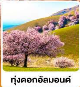
ทุ่งดอกอัลมอนต์