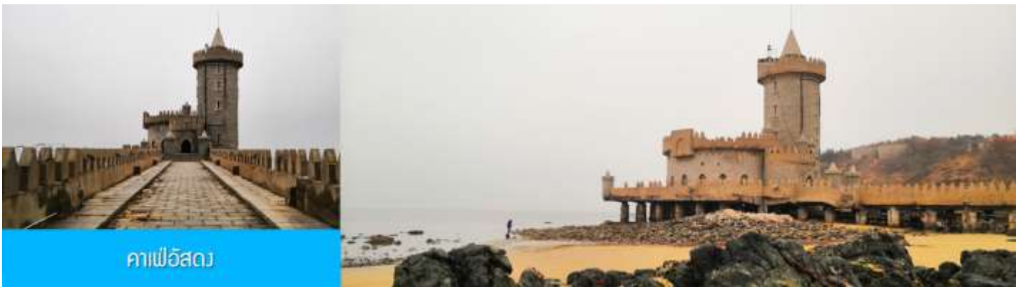
คาเฟ่อีสต

จากนั้นนำท่าน เดินทางสู่ คาเฟ่อีสต 落日古堡 นำท่านชมปราสาทในเทพนิยาย ที่ตั้งตระหง่านอยู่ริม ชายหาดนานาชาติเวย์ไห่ คาเฟ่ที่ออกแบบด้วยสถาปัตยกรรมสไตล์ยุโรป ตัดกับวิวทะเลเล็คคราม และที่นี่คือ แม่เหล็กดึงดูดนักท่องเที่ยวมาเก็บบรรยากาศความสวยงามความโรแมนติก (ตัวปราสาทเป็นร้านกาแฟ หากท่าน ต้องการเข้าไปด้านใน ต้องจ่ายค่าเครื่องดื่ม ตามเมนูของทางร้าน ซึ่งไม่รวมในอัตราค่าทัวร์)