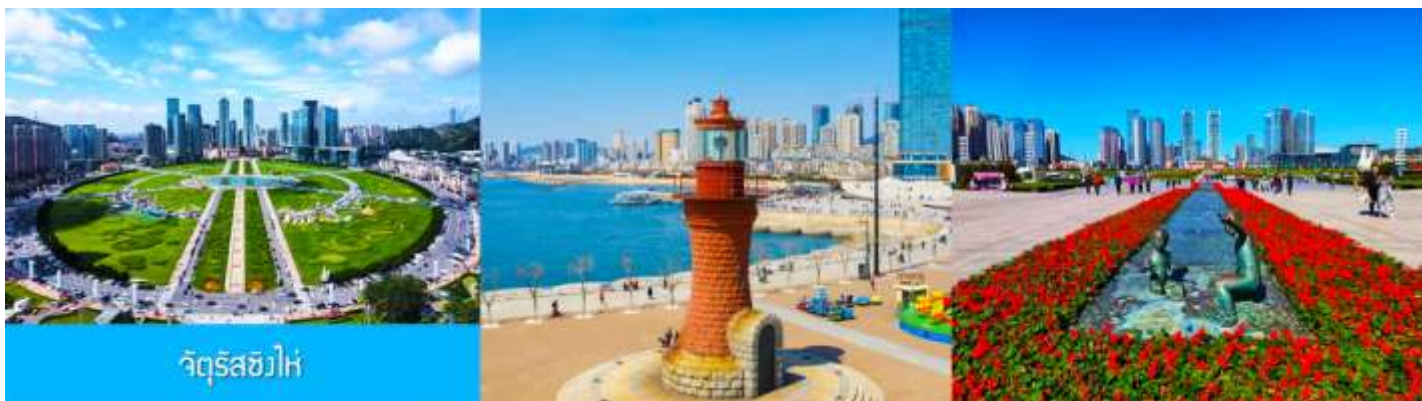
จัตุรัส星海

หลังอาหารนำท่านเที่ยวชม จัตุรัส星海广场 เป็นจัตุรัสขนาดใหญ่เป็นแลนด์มาร์คสำคัญของเมืองต้าเหลียน สร้างขึ้นเพื่อเฉลิมฉลองในโอกาสที่รัฐบาลอังกฤษคืนเกาะฮ่องกงในให้จีนในปี ค.ศ. 1997 ตั้งอยู่ชายฝั่งทะเลในเมืองต้าเหลียน เป็นจัตุรัสใจกลางเมืองที่ใหญ่ที่สุดในโลกและเป็นแลนด์มาร์คของเมืองต้าเหลียน รายล้อมด้วยตึกระฟ้าที่ทันสมัย ภายในมีบ่อน้ำพุดนตรี ลานหญ้าขนาดใหญ่ และลานกว้างสำหรับจัดกิจกรรมกลางแจ้ง อาทิ เทศกาลเบียร์นานาชาติ การแข่งขันวิ่งมาราธอน งานแฟชั่นนานาชาติเมืองต้าเหลียน ฯลฯ