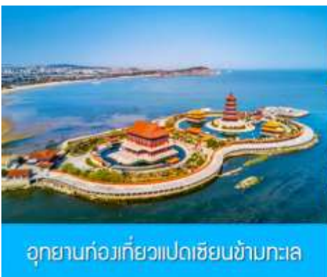
อุทยานท่องเที่ยวแปดเซียนข้ามทะเล