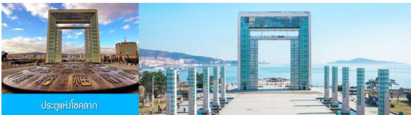
ประตูปวงโซลกาล