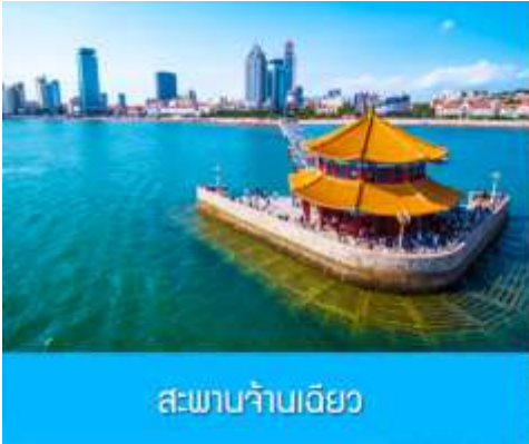
สะพานจ้านเจียว