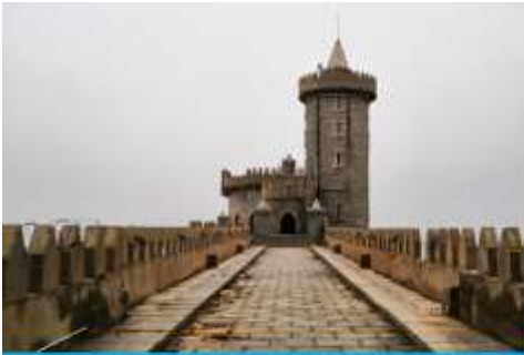
คาเฟ่อีสถง