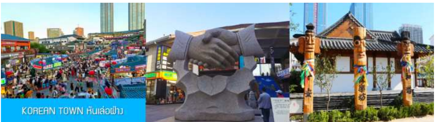
KOREAN TOWN หับล้อมฟ้า