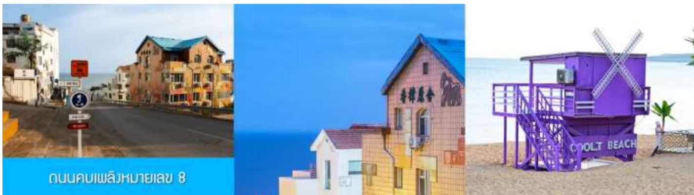
ถนนคบเพลิงหมายเลข 8

นำท่านชม สวนสาธารณะเวย์ไห่ 威海公园 สวนสาธารณะริมทะเลที่ใหญ่ที่สุดของเมืองเวย์ไห่ ให้ท่านชมและถ่ายภาพคู่กับ กรอบรูปยักษ์วิวทะเล 威海公园大相框 แลนด์มาร์คที่เป็นอีกหนึ่งไฮไลท์ที่ฮิตของเมืองเวย์ไห่