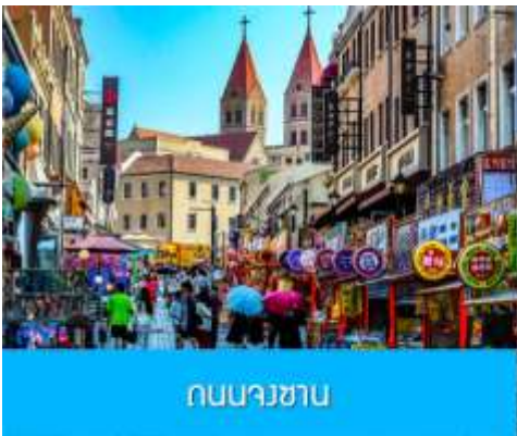
ถนนนางซาน