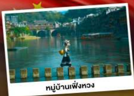
หมู่บ้านเฟิ่งทง

สุดคุ้ม!! พัก 5 ดาว ทุกคืน มนตร์เสน่ห์เมืองเก่า ริมสาងน้ำแจ่มใสแดน