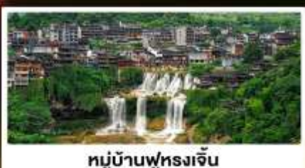
หมู่บ้านฟุทงเจิน