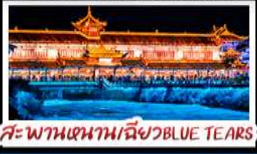
สะพานห่านเขียว BLUE TEARS

สวนบ้านฮวา - อุทยานหลุมฟ้าสะพานสวรรค์ สีดรุณี - หงหยาดัง - รถไฟฟ้าทะเลลึก สะพานห่านเขียว BLUE TEARS พักโรงแรมระดับ 4 ดาว - ไม่ลงร้านช้อปปิ้ง เมนูพิเศษ สุกีหม่าล่า เปิดปิกนิก