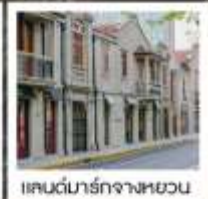
แลนด์มาร์กจางหยวน

เซี่ยงไฮ้ คคลาศสิก ไท่ / 3 ดึกใหญ่แห่งเซี่ยงไฮ้ คองเรือหมู่บ้านโบราณจูเจียเจียว / EKA Tianwu / วัดหลงหัว แลนด์มาร์ก จางหยวน / ถนนหวยไห่ / ชมโชว์ ERA ที่โรงละครโด่งดังระดับโลก / ซินเทียนตี้