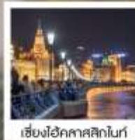
เซี่ยงไฮ้ คคลาศสิก ไท่