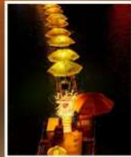
ล่องเรือมังกร แม่น้ำก้งสู่ย