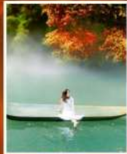
ผิงชาน แกรนด์แคนยอน