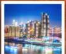
ตึก RAFFLES CITY