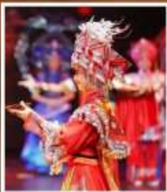
โชว์ระบำกู่เจีย