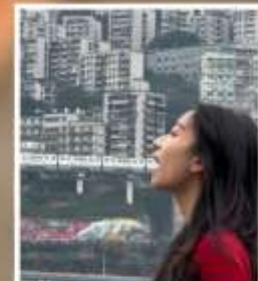
กินรถไฟฟ้ากะลุดัก