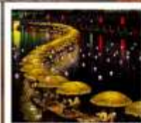
คลองเรือมังกรก่งฝูย