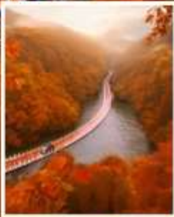
จุดดำขำ ซีจื่อกวาน

รับฟรี!! ประกันสุขภาพ และ อุบัติเหตุ 2 ล้านบาท