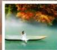
แกรนด์แคนยอนผิงซาน

หงหยาดัง / จุดดำซาซือจื่อกวาน (หุบเขาสิงโต) คลองเรือมังกรแม่น้ำก่งฝูยชววิยานค่าคิ่น / ผิงซานแกรนด์แคนยอน (รวมคลองเรือ) เมืองโบราณกุซือตัง / เมืองโบราณนวิเออร์ตัง / ไร่ระบำกู่ฝูย / ดำซาจุดกักรถไฟฟ้ากะคุตัก เมืองโบราณซือปาเก้ / ถนนคนเดินเจียฟ่างเป้ย / ชมวิวยานค่าคิ่น Raffles City Chongqing