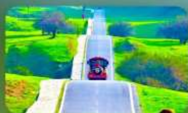
เขานางฟ้า