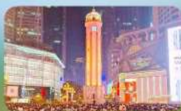
ถนนคนเดินเจียฟางเป่ย์