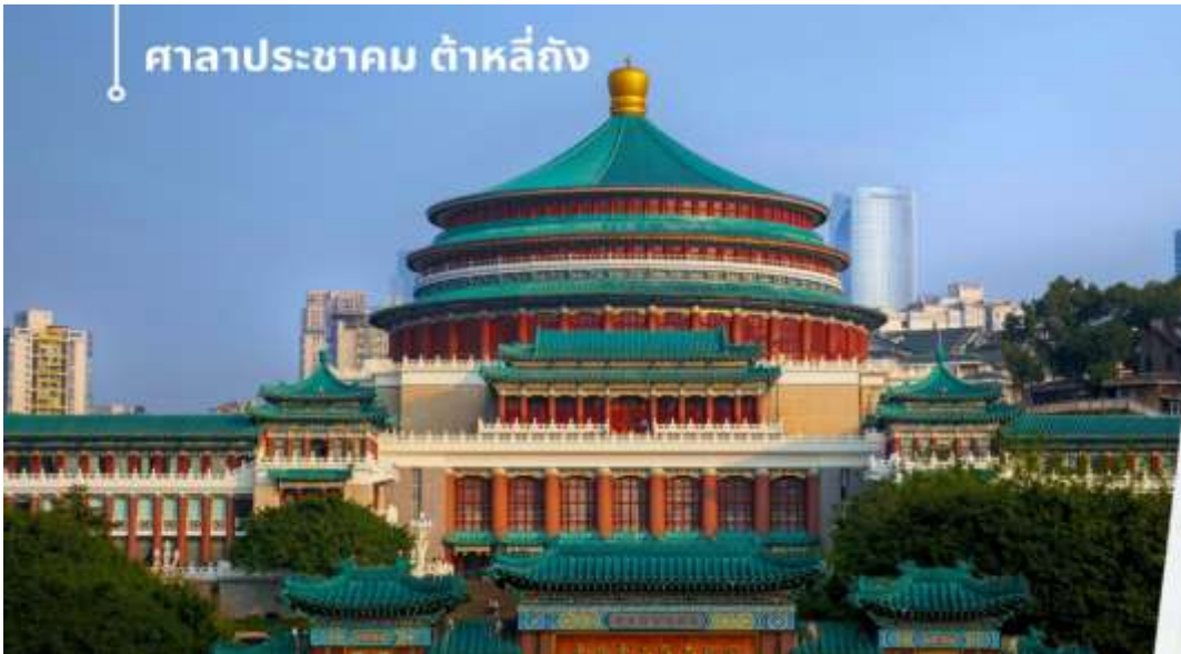
ศาลาประชาคม ท่าหลัก

นำท่านเดินทางสู่ ศาลาประชาคม (ด้านนอก) เป็นสถานที่หนึ่งในสัญลักษณ์ของเมืองฉงชิ่ง ด้วยสีส้มและรูปแบบการจัดวางอย่างโดดเด่นและลงตัว มีการผสมผสานของศิลปะในยุคราชวงศ์หมิงและราชวงศ์ชิงเข้าไว้ด้วยกัน ด้านหน้าจะเป็นลานกว้างในตอนเย็นและตอนกลางคืนจะมีผู้คนจำนวนมากเข้ามารวมตัวกันทำกิจกรรม ไม่ว่าจะเป็นการเต้นแอโรบิค เดินเล่น ปิกนิก เดินชมแสงไฟยามค่ำคืน จัดนิทรรศการต่างๆ