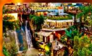
ถนนโบราณหลงเหมินฮ่าว