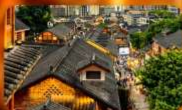
เมืองโบราณสี่ปาตี