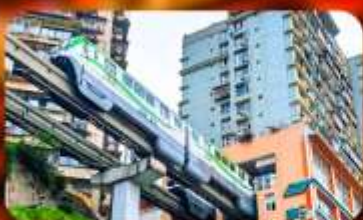
รถไฟฟ้ายักษ์