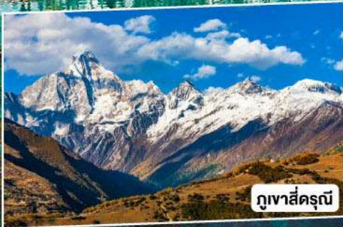
ภูเขาสี่ครุณี