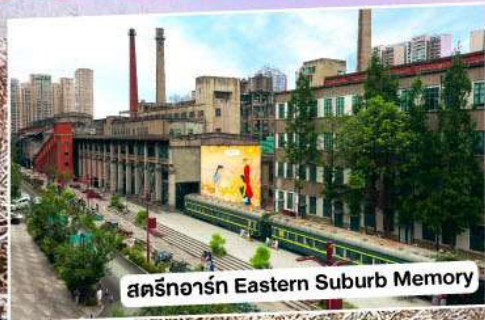
สตรีทอาร์ต Eastern Suburb Memory