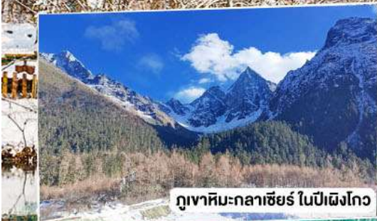
ภูเขาหิมะกลาเซียร์ ในปี่ผิงโกว