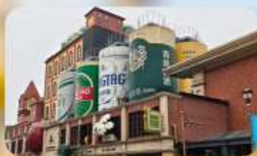
โรงงานเบียร์ชิงเต่า