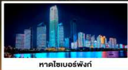
หาดโซเบอร์ฟิงก์