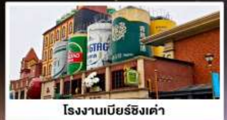
โรงงานเบียร์ชิงเต่า