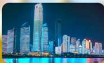
หาดโซเบอร์ฟังก์