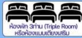
ห้องพัก 3 ท่าน (Triple Room) หรือห้องแบบเตียงเสริม

กรณีพัก 3 ท่านถ้าวันที่เข้าพักโรงแรม ไม่มีห้อง TRP (3 ท่าน) อาจจำเป็นต้องแยกพัก 2 ห้อง (มีค่าใช้จ่ายพักเดี่ยวเพิ่ม) กรณีห้อง TWIN BED (เตียงเดี่ยว 2 เตียง) ซึ่งโรงแรมไม่มีหรือเต็ม ทางบริษัทขอปรับเป็นห้อง DOUBLE BED แทนโดยมีต้องแจ้งให้ทราบล่วงหน้า หรือ หากต้องการห้องพักแบบ DOUBLE BED (1 เตียงใหญ่) ซึ่งโรงแรมไม่มีหรือเต็ม ทางบริษัทขอปรับเป็นห้อง TWIN BED แทนโดยมีต้องแจ้งให้ทราบล่วงหน้า กรณีห้องพักในเมืองที่ระบุไว้ในโปรแกรมมีเทศกาลวันหยุดยาว มีงานประชุมหรืองานแฟร์ต่างๆ บริษัทขอจัดที่พักในเมืองใกล้เคียงแทน