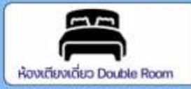
ห้องเตียงเดี่ยว Double Room