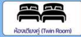
ห้องเตียงคู่ (Twin Room)