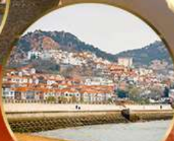
ซาจื่อไห่