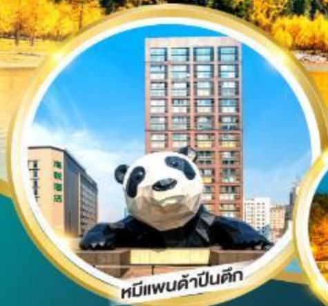
หมีแพนด้าป็นตึก