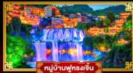
หมู่บ้านฟุทรงเจิ้น