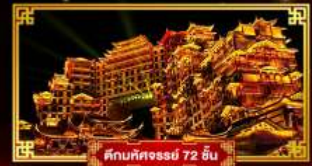
คันทศวรรษ 72 ชัน