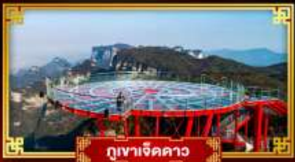
กูเขาเจ็ดดาว