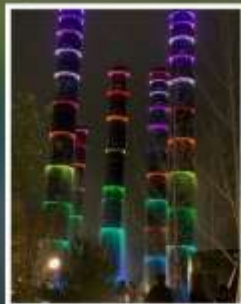
แสง สี ห้าง SKP