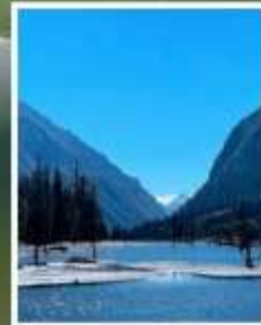
อุทยานชวงเฉียวโกว