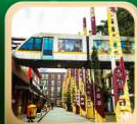
“ดงเจียวจื่อ”