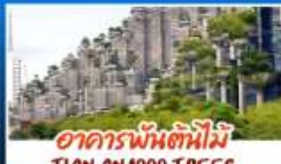
อาคารพันต้นไม้อาณาจักร TIAN AN 1000 TREES