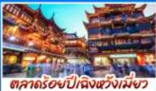
ตลาดร้อยปีผิงหวังเหมิงว