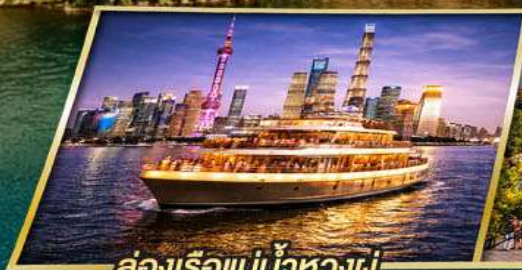
ล่องเรือแม่น้ำหวงผู่