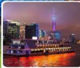
ส่องเรือแม่น้ำหวงผู่