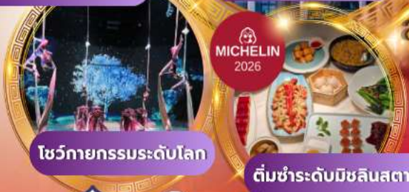
โชว์กายกรรมระดับโลก