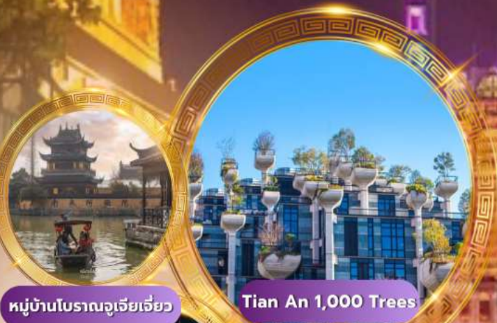
หมู่บ้านโบราณจูเจียเจี้ยว

hi class "เซี่ยงไฮ้..ไฮคลาส" บินหรู Full service พัก 5 ดาวย่านช้อปปิ้ง