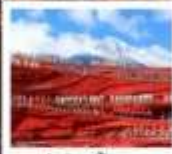
โซ่วจางอีหมว