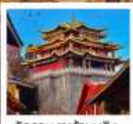
วัดสามะชงจันหลิง