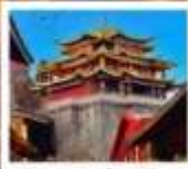
วัดทาน-ชงจ้านหลิง