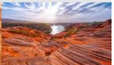
อุทยานหุบเขาคีลิน

*ทางบริษัทฯ ขอสงวนสิทธิ์ในการสลับโปรแกรมทัวร์ตามความเหมาะสมขึ้นอยู่กับสถานการณ์ทำงาน โดยค่าใช้จ่ายผลประโยชน์ของลูกค้าเป็นสำคัญ