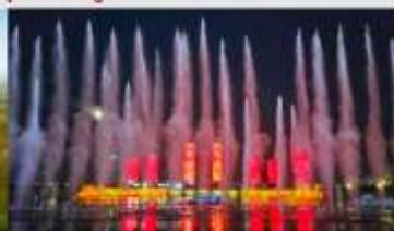
น้ำพุคังปาซือ