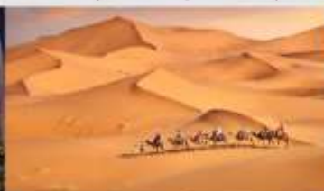
ทะเลทรายเสียงชวาม