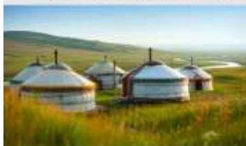
ทุ่งหน้าออร์ดอส