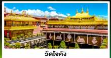
วัดโจกัง