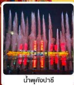
น้ำพุคังปาซี

● โฮลท์ เป็นทราเวลสายการบิน ระดับ 5A ของจีน ภูเขาไฟอูลันฮาตา น้ำพุคังปาซี น้ำพุที่สูงที่สุดในเอเชีย