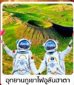
อุทยานภูเขาไฟอูลันฮาตา