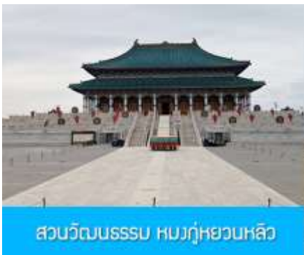
สวนวัฒนธรรมหมงกู่หยวนหลิว

พักที่ ORDOS BOYU AIRUI HOTEL โรงแรมระดับ 4 ดาวท้องถิ่น หรือเทียบเท่าในเมืองเออร์ดอส