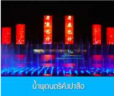
น้ำพุดนตรีคังปาสื่อ

จากนั้นนำท่านเดินทางกลับสู่ เมืองเออร์ดอส 鄂尔多斯 (ระยะทาง 180 กิโลเมตรใช้เวลาประมาณ 3 ชั่วโมง ) รับประทานอาหารค่ำ ณ ภัตตาคาร (9)