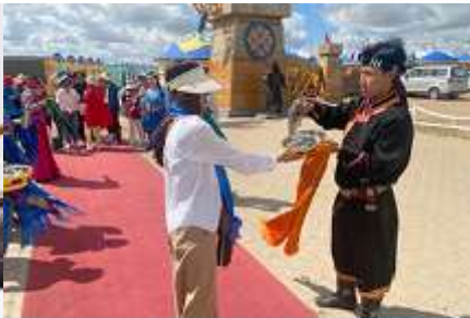
พิธีต้อนรับแขกด้วยเหล้า