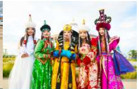
แต่งชุดพื้นเมืองมองโกล