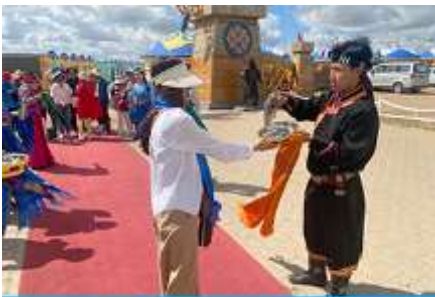
พิธีต้อนรับแขกด้วยเหล้า

รับประทานอาหารกลางวัน ณ ร้านอาหารพื้นเมืองในเขตอุทยาน (8)