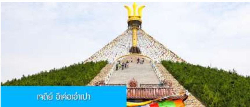
เจดีย์ อี้เค่อเอ้าเป่า

พักที่ DALAETQI SHNAGJING HOTEL โรงแรมระดับ 4 ดาวหรือเทียบเท่าในเมืองต้าลาเท่อ