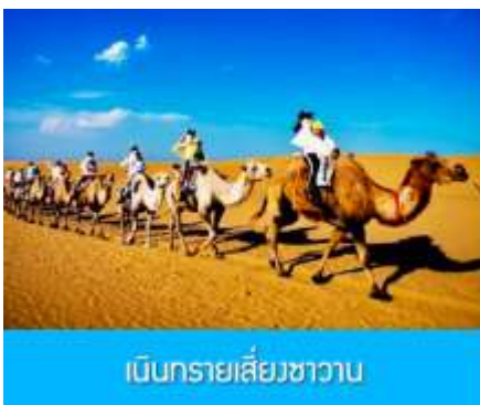
เบ็นทรายเลี้ยงชาวาน

เที่ยง รับประทานอาหารกลางวัน ณ ภัตตาคาร (11)