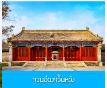
จวนอ๋องจวินหวัง