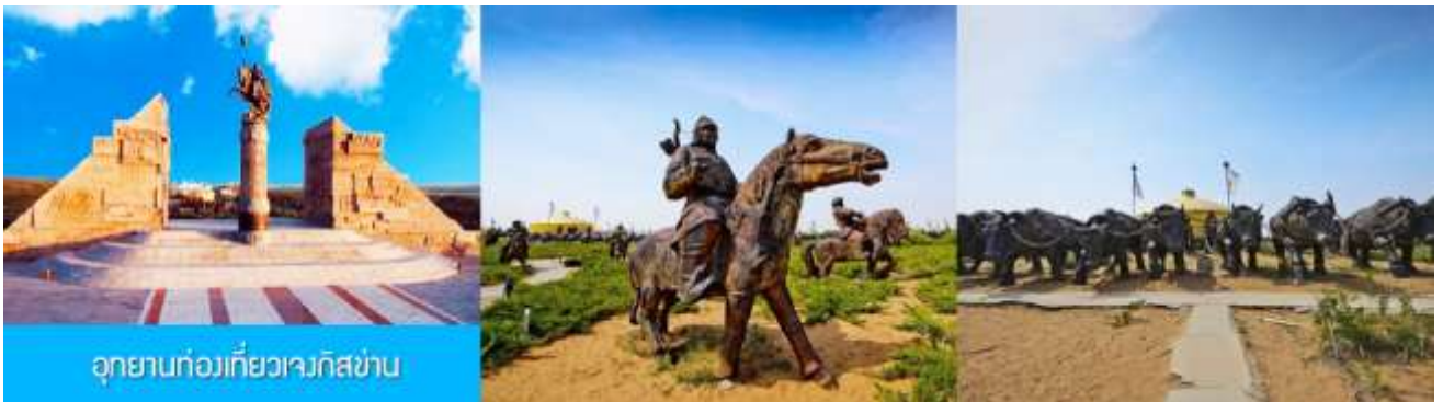
อุทยานท่องเที่ยวเจงกิสข่าน