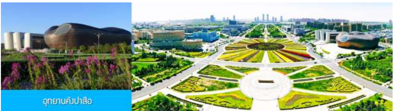
อุทยานคังปาสือ