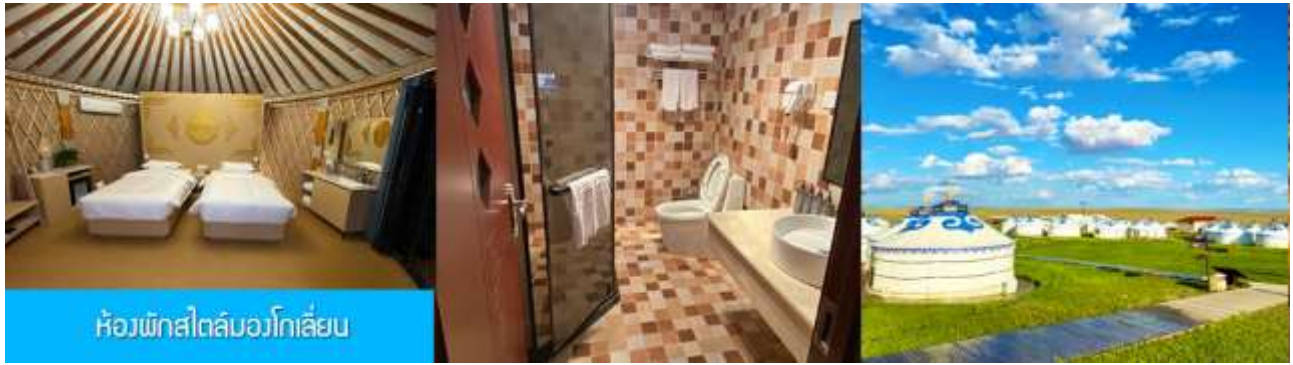
ห้องพักสไตล์มองโกเลีย

พักที่ ORDOS GLASSLAND MONGOLIAN YURT เป็นห้องพักสไตล์มองโกเลีย (ระโจม)