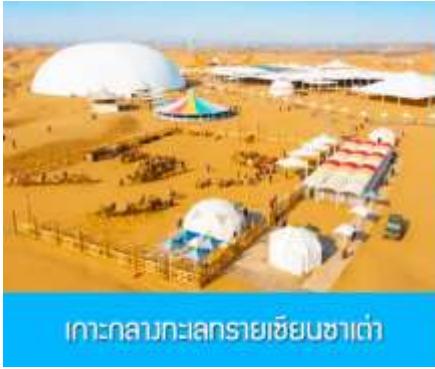
เกาะกลางทะเลทรายเซียนซาเต่า