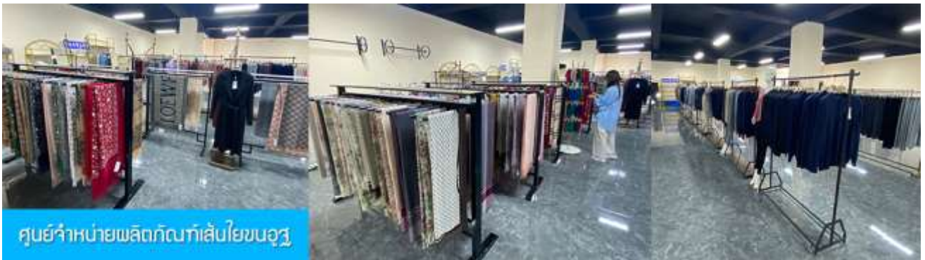
ศูนย์จำหน่ายผลิตภัณฑ์เส้นใยขนอูฐ

พักที่ ORDOS GLASSLAND MONGOLIAN YURT เป็นห้องพักสไตล์มองโกเลีย (ระโจม)