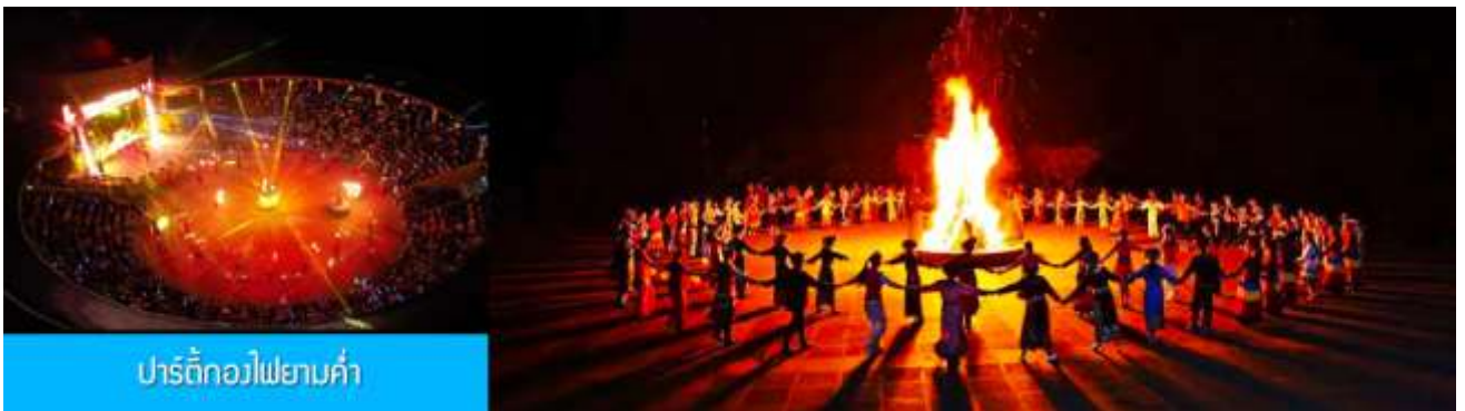
ปาร์ตี้กองไฟยามค่ำ