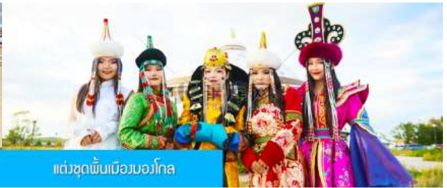
แต่งชุดพื้นเมืองมองโกล