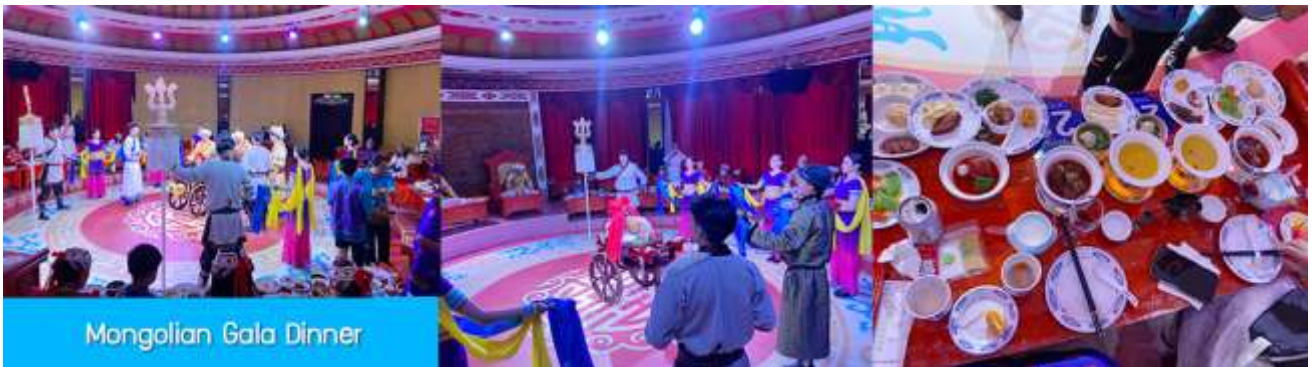
Mongolian Gala Dinner

那达慕 Naadam Festival หรือเทศกาลเฉลิมฉลองที่คล้ายวันตรุษจีนของชาวจีน ประกอบด้วยกิจกรรมพื้นเมืองแบบมองโกลรวม 22 อย่าง ได้แก่ พิธีแต่งงานเออร์โดส / การขี่ม้าในสนาม / ปาร์ตี้รอบกองไฟ / จักรยานแข่ง / สไลเดอร์หญ้า / รถลากทุ่งหญ้า / สวนเขาวงกต / สวนเด็กเล่น / ดิกอล์ฟทุ่งหญ้า / รถบั้งเปเปอร์ / รถโกคาร์ท / โยนบอลทุ่งหญ้า / ปืนไฟมองโกล / ยิงธนูในร่ม / แข่งขันจับแกะ / คล้องม้าจำลอง / หมูเลี้ยงนำเอ็นดู / เครื่องเล่นหมุน / เลี้ยงแกะโยน / ยิงธนู / ทอยแจกัน / เซ็นต์ชื่อภาษามองโกลให้เลือกเล่นได้ 12 อย่างตามรายการที่ระบุ.....อัตราค่าบริการสำหรับ 那达慕 Naadam Festival 380 หยวน หรือ 1,900 บาท/ท่าน (สำหรับลูกค้าทัวร์ที่ไม่ซื้อโปรแกรมเสริม สามารถเดินเล่น ถ่ายรูปบริเวณทุ่งหญ้าหรือพักผ่อนตามอัธยาศัย)