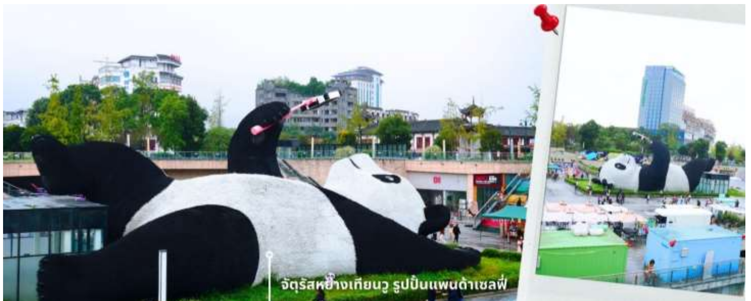
จัตุรัสหยางเทียนวู รูปปั้นแพนด้าเซลฟ์

นำท่านเดินทางไปยัง จัตุรัสหยางเทียนวู เป็นจุดเช็คอินที่สำคัญสำหรับคนที่มาเที่ยวที่ เมืองตูเจียงเยียน บริเวณจุดท่าข้าม อำเภอตูเจียงเยียน นครเฉิงตู ไฮไลท์ของจัตุรัสหยางเทียนวู คือ ประติมากรรม แพนด้ายักษ์ที่กำลังนอนหงายท้องยื่นมือถือไม้เซลฟี่สีชมพู ซึ่งออกแบบโดยนักออกแบบชื่อดัง Florentijn Hofman รูปปั้นแพนด้า ยักษ์มีความยาว 26 เมตร กว้าง 11 เมตร สูง 12 เมตร และหนัก 130 ตัน แบบท่าทางสบายๆของแพนด้าที่ความประทับใจและรอยยิ้มให้กับผู้ที่มาเยือนจัตุรัสหยางเทียนวู สามารถดึงดูดนักท่องเที่ยวได้เป็นจำนวนมากเลยทีเดียว เป็นการแสดงออกด้วยภาษาทางศิลปะแบบหนึ่งที่สะท้อนชีวิตในท้องถิ่น มอบความรู้สึกสนิทสนมและมีความสุขกับผู้ชม อิสระเดินชม