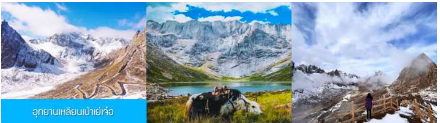
อุทยานเหลียนเป่าเย่าจ้าว

พักที่ โรงแรม ZUNGE ZHUOYUE HOTEL ระดับ 4 ดาวท้องถิ่นหรือเทียบเท่าในอำเภออาป้า