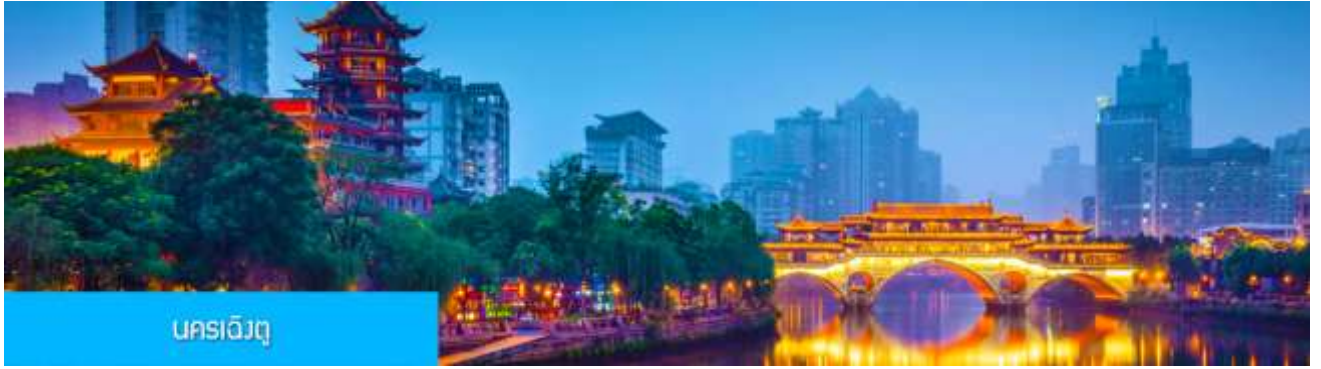
นครเฉิงตู