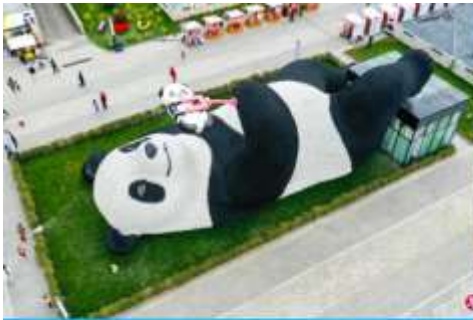
ตุ๊กตาหมีแพนดาเซลฟี