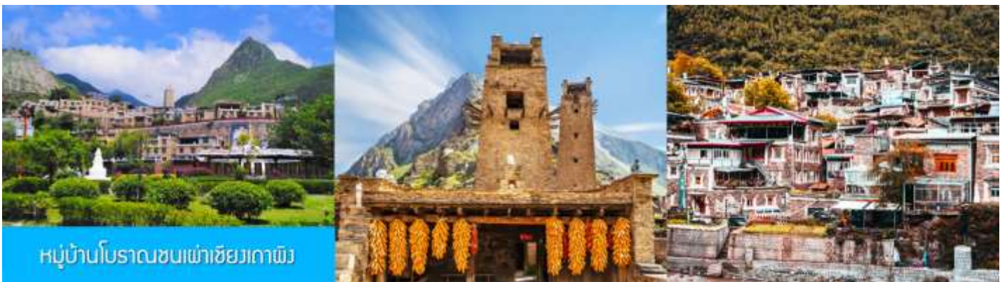
หมู่บ้านโบราณซบเผ่าชียงกาแพ็ง