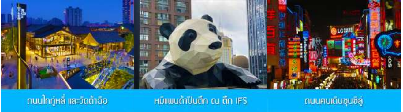
ถนนไท่กุ่หลี่ และวัดต้าเจี๋ย