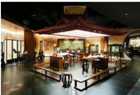
พิพิธภัณฑ์ผ้าปักเสฉวน