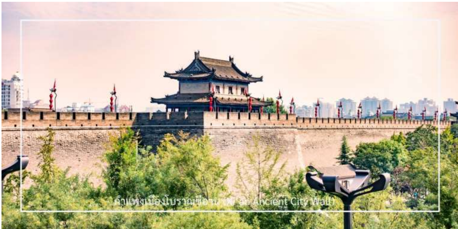
กำแพงเมืองโบราณซีอาน (Xi'an Ancient City Wall)

นำท่านขึ้นชม กำแพงเมืองโบราณซีอาน (Xi'an Ancient City Wall) อีกหนึ่งกำแพงเมืองโบราณเก่าแก่และสมบูรณ์ที่สุดของจีน สร้างขึ้นในสมัยราชวงศ์หมิงเมื่อกว่า 600 ปีก่อน มีความยาวโดยรอบประมาณ 13.7 กิโลเมตร กว้าง 12-14 เมตร และสูงราว 12 เมตร ออกแบบอย่างแข็งแกร่งเพื่อการป้องกันเมือง โดยมีป้อม ประตูเมือง และคูน้ำล้อมรอบ ปัจจุบันกลายเป็นแหล่งท่องเที่ยวยอดนิยม นักท่องเที่ยวสามารถเดินเล่นหรือปั่นจักรยานบนกำแพง เพื่อชมทัศนียภาพของเมืองซีอานทั้งภายในและภายนอกเขตกำแพงได้อย่างชัดเจน