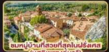
ชมหมู่บ้านที่สวยงามที่สุดในฝรั่งเศส (มูสดีเยแซงมารี)