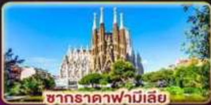
ซากradaฟามีเลีย