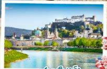
ซาคส์บวร์ค