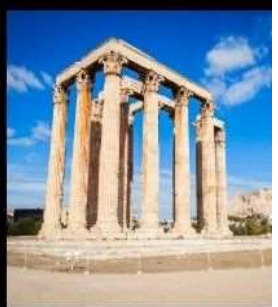
Temple Of Olympian