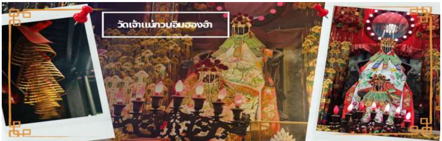
วัดเจ้าแม่กวนอิมสองห้า

จากนั้นนำท่านเดินทางสู่ วัดเจ้าแม่กวนอิมสองห้า (HUNG HOM KWUN YUM TEMPLE) เป็นหนึ่งในวัดที่ชาวฮ่องกงนั้นเลื่อมใสกันมาก ด้วยความที่เจ้าแม่กวนอิมนั้นเป็นเทพเจ้าแห่งความเมตตา ฉะนั้นเมื่อใครมีทุกข์ร้อนอะไรก็มักจะมาราบไหว้ขอพรให้เจ้าแม่ช่วยเหลือ วัดนี้ถูกสร้างขึ้นในปี ค.ศ.1873 ในช่วงสงครามโลกครั้งที่ 2 มีการปล่อยระเบิดลงบริเวณวัดของห้าหลายต่อหลายครั้ง ทำให้มีผู้บาดเจ็บและล้มตายมากมาย แต่ชาวบ้านที่หนีเข้าไปหลบภัยในวัดนี้ก็กลับปลอดภัยและตัววัดก็ไม่ได้ได้รับความเสียหายจากเหตุการณ์ที่ระเบิดอย่างน่าอัศจรรย์และวันสำคัญอีกวันหนึ่งที่คนหลังไหลมาไหว้ขอพรอย่างไม่ขาดสาย และรอคอยเป็นประจำทุกปี ก็คือ "วันเปิดทรัพย์" หรือ วันยืมเงินเทพเจ้า เป็นวันที่จะมาขอพรและยืมเงินเจ้าแม่กวนอิม ซึ่งตรงกับวันที่ 26 นับจากวันตรุษจีน ซึ่งพิธีนี้ใน 1 ปี มีเพียงครั้งเดียวเท่านั้น