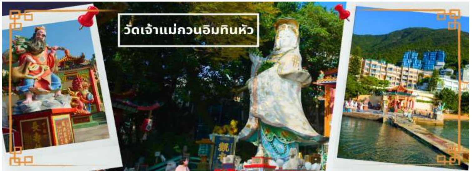
วัดเจ้าแม่กวนอิมทึนหิว

จากนั้นนำท่านเดินทางสู่ วัดเจ้าแม่กวนอิมสองห้า (HUNG HOM KWUN YUM TEMPLE) เป็นหนึ่งในวัดที่ชาวฮ่องกงนั้นเลื่อมใสกันมาก ด้วยความที่เจ้าแม่กวนอิมนั้นเป็นเทพเจ้าแห่งความเมตตา ฉะนั้นเมื่อใครมีทุกข์ร้อนอะไรก็มักจะมาราบไหว้ขอพรให้เจ้าแม่ช่วยเหลือ วัดนี้ถูกสร้างขึ้นในปี ค.ศ.1873 ในช่วงสงครามโลกครั้งที่ 2 มีการปล่อยระเบิดลงบริเวณวัดของห้าหลายต่อหลายครั้ง ทำให้มีผู้บาดเจ็บและล้มตายมากมาย แต่ชาวบ้านที่หนีเข้าไปหลบภัยในวัดนี้ก็กลับปลอดภัยและตัววัดก็ไม่ได้ได้รับความเสียหายจากเหตุการณ์ที่ระเบิดอย่างน่าอัศจรรย์และวันสำคัญอีกวันหนึ่งที่คนหลังไหลมาไหว้ขอพรอย่างไม่ขาดสาย และรอคอยเป็นประจำทุกปี ก็คือ "วันเปิดทรัพย์" หรือ วันยืมเงินเทพเจ้า เป็นวันที่จะมาขอพรและยืมเงินเจ้าแม่กวนอิม ซึ่งตรงกับวันที่ 26 นับจากวันตรุษจีน ซึ่งพิธีนี้ใน 1 ปี มีเพียงครั้งเดียวเท่านั้น